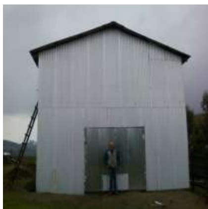
Proyecto galpón 2º piso sector Porvenir