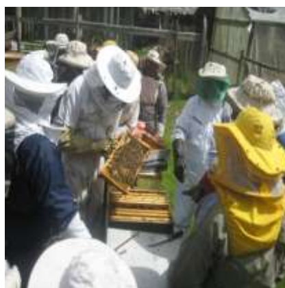
Curso Manejo del entorno del colmenar