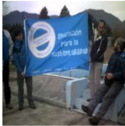
Capacitación Localidad De Malalcahuello Sistema Nacional De Certificación Ambiental De Escuelas