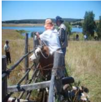
Entrega y Postura de Aretes