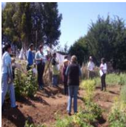
Capacitaciones en Terreno.