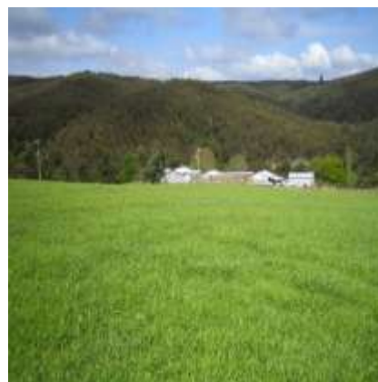
Predio Modulo Demostrativo Pecuario