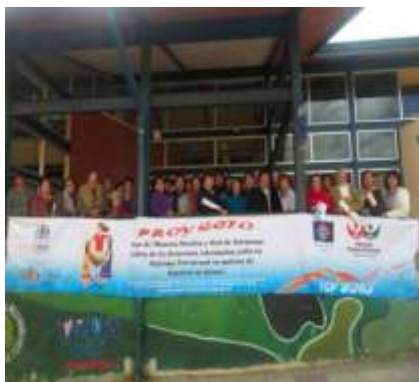
Capacitación Sistema de Previsión Social, Proyecto mesa de la Mujer Rural