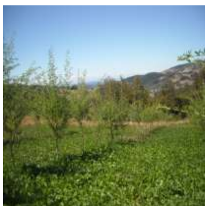
Promoción de alternativas forrajeras para zonas de secano Plantación de