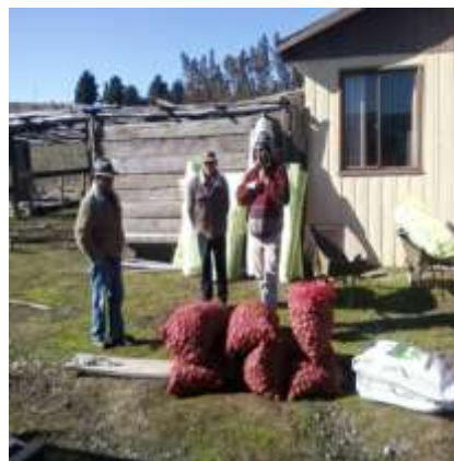
Entrega semillas de papas certificadas y fertilizantes sector Juana Manquiñir