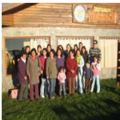
Curso Desarrollo Capacidad Emprendedora