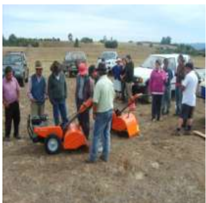
Capacitación de motocultivadores