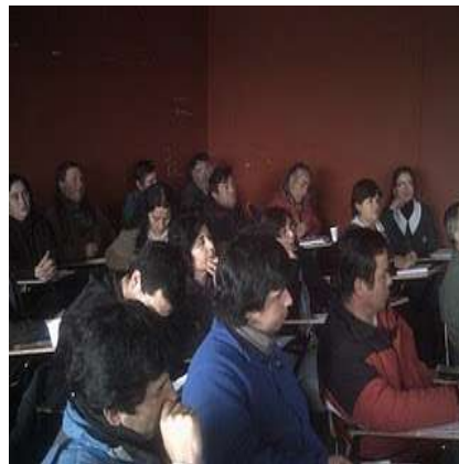
Taller De Residuos Sólidos Domiciliarios