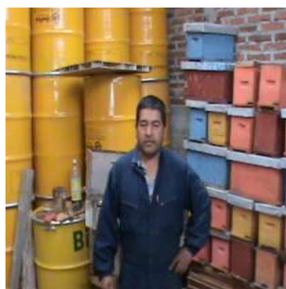
Apoyo a la construcción de planta extracción y envasado miel