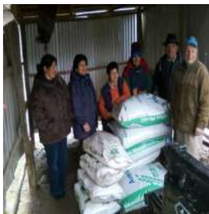
Entrega semillas de Avena certificadas y fertilizantes sector Porvenir Bajo.-