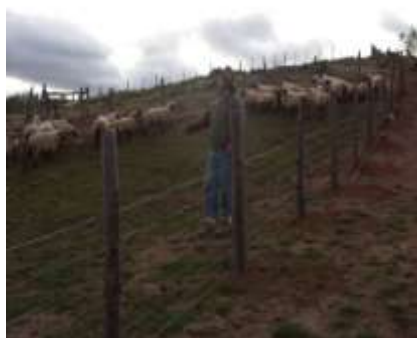
Promoción del Desarrollo Producción Ovina, Banco ovino Prodesal San Ramón