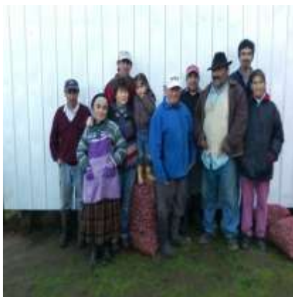
Entrega semillas de papas certificadas sector Porvenir alto