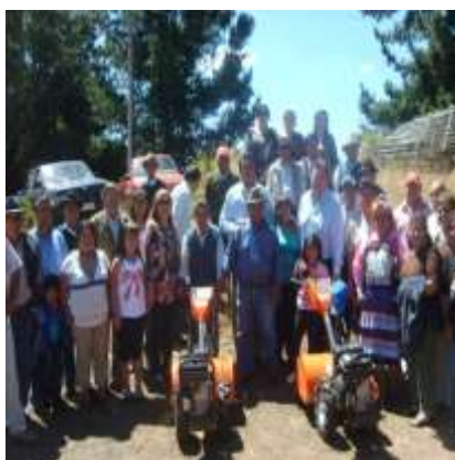
Inauguración de Motocultivadores