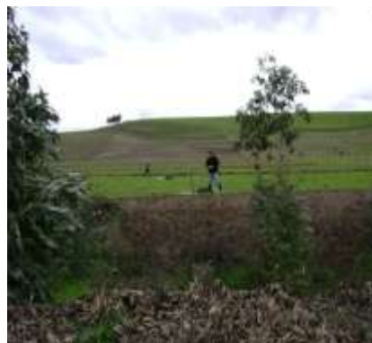
Predio Modulo Agroforestal convenio INFOR