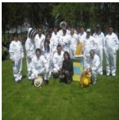
Curso Manejo del entorno del colmenar