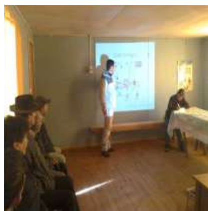
Charlas de capacitación en enfermedades parasitarias (SAG), SECTOR Cerro Águila