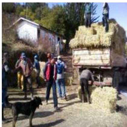
Entrega de fardos como ayuda de emergencia.-